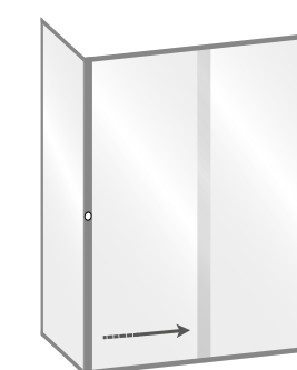
MOD. SINISTRO SENZA MANIGLIA CON APERTURA A SINISTRA LATO FISSO A SINISTRA