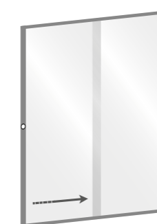
MOD. SINISTRO SENZA MANIGLIA CON APERTURA A SINISTRA