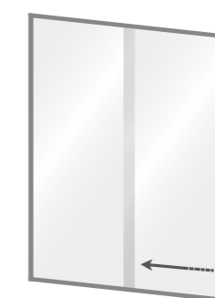
MOD. DESTRO SENZA MANIGLIA CON APERTURA A DESTRA